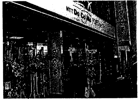
駅前から徒歩1分と好立地の店舗