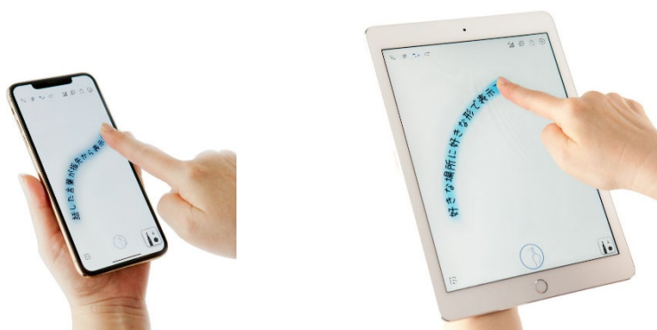
「しゃべり描き®アプリ」の使用イメージ(左:スマートフォン、右:タブレット)

兼松コミュニケーションズ株式会社(以下、兼松コミュニケーションズ)と三菱電機株式会社(以下、三菱電機)は、聴覚障がい者支援団体などを対象に、話した言葉を指でなぞった軌跡に表示する「しゃべり描き®アプリ Biz」の無償提供を9月4日に開始しますのでお知らせします。新型コロナウイルス感染症対策としてマスクを着用することが常態化し、口元が見えずコミュニケーションに困るシーンにおいて本アプリをご利用いただくことで、円滑なコミュニケーションの実現に貢献します。